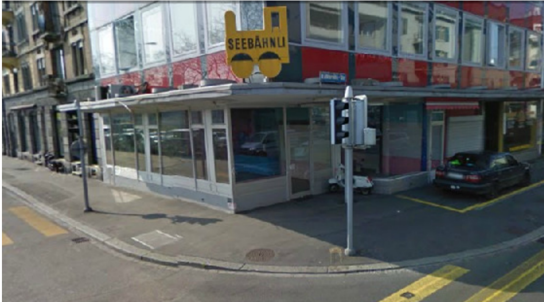
Ehem. Rest. Seebähkli, Kalkbreitestr. 33, 8003 Zürich