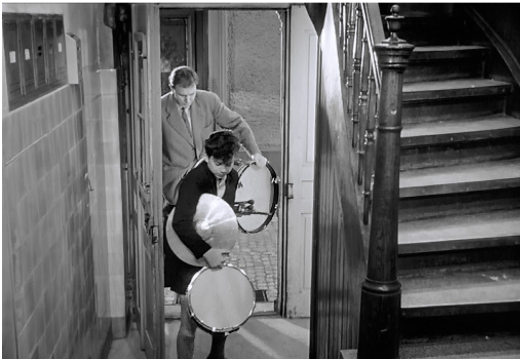
Schöneeggstr. 12, 8004 Zürich (aus: Kurt Früh, Bäckerei Zürrer, 1955)