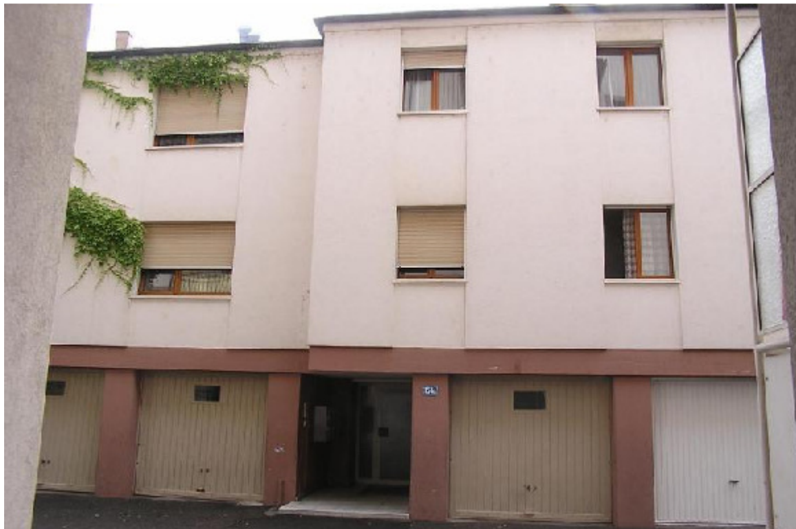
Claragraben 154a, 4057 Basel (1962)